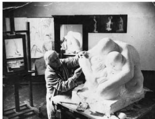
Présentation de Sylvie Doizelet